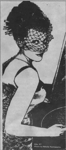
Alla NY